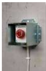
SCG1EE monterad runt SCB3DL